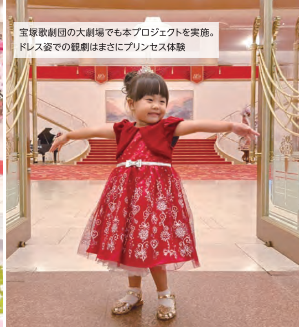
宝塚歌劇団の大劇場でも本プロジェクトを実施。ドレス姿での観劇はまさにプリンセス体験