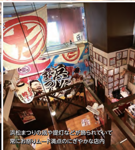
浜松まつりの凧や提灯などが飾られていて常にお祭りムード満点のにぎやかな店内