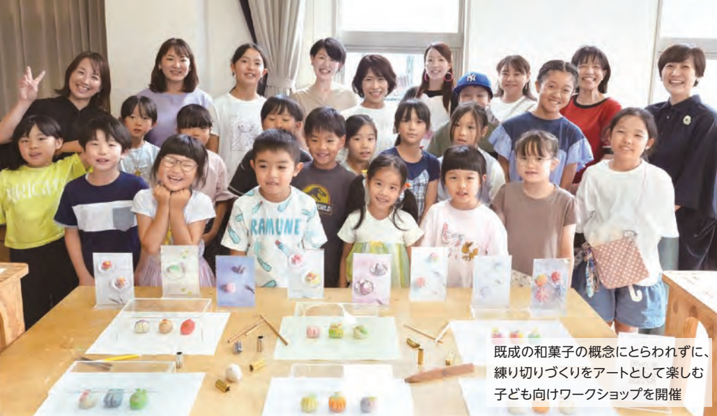
既成の和菓子の概念にとらわれずに、練り切りづくりをアートとして楽しむ子ども向けワークショップを開催