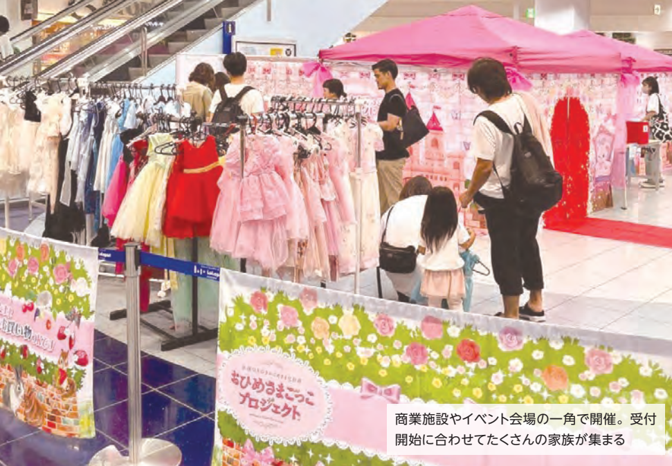
商業施設やイベント会場の一角で開催。受付開始に合わせてたくさんの家族が集まる