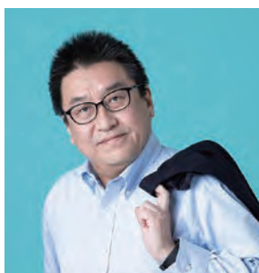
地域経済アナリスト／コンサルタント

若い世代から「自分もあんなカッコいい大人になりたい」と言われるような人がたくさんいる地域は、元気になってそれが次の世代にも受け継がれ、良い連鎖を生んでいくでしょう。これは地域経済だけでなく、会社組織であれ、政治であれ、行政であれ、どんなシーンにおいても共通する大事な見方だと、今回気付かされました。