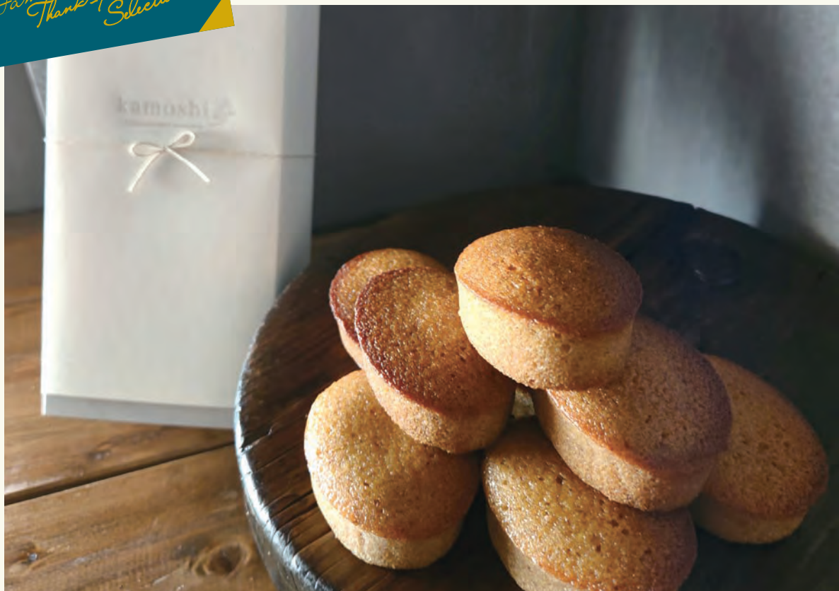
ふっくらとした厚みの楕円形フィナンシェ。1個300円 6個入り2050円 8個入り2650円