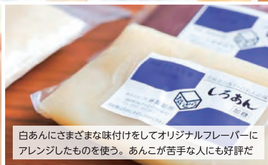
白あんにさまざまな味付けをしてオリジナルフレーバーにアレンジしたものを使う。あんこが苦手な人にも好評だ