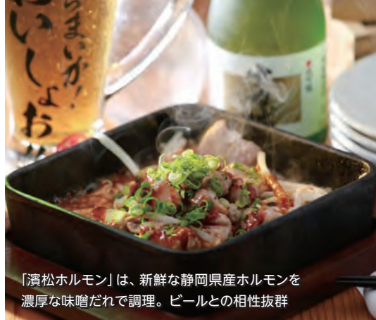
「濱松ホルモン」は、新鮮な静岡県産ホルモンを濃厚な味噌だれで調理。ビールとの相性抜群