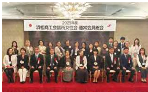
女性会通常会員総会