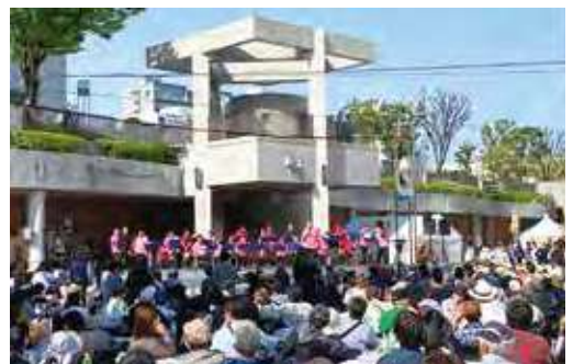
アクトでやрмаいか 浜松まつり