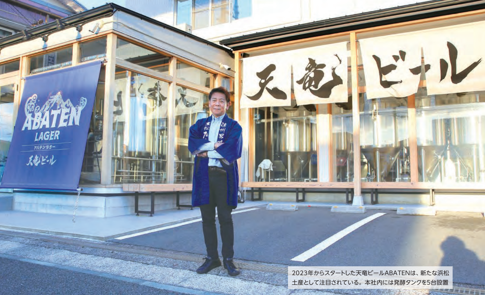
2023年からスタートした天竜ビールABATENは、新たな浜松土産として注目されている。本社内には発酵タンクを5台設置