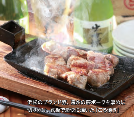
浜松のブランド豚、遠州の夢ポークを厚めに切り分け、鉄板で豪快に焼いた「ごろ焼き」