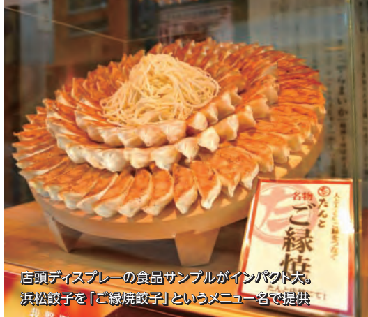
店頭ディスプレイの食品サンプルがインパクト大。浜松餃子を「ご縁焼餃子」というメニュー名で提供