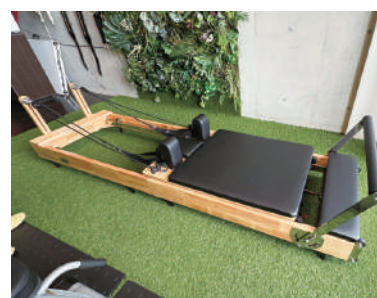
初心者でも無理なくできるマシンピラティス