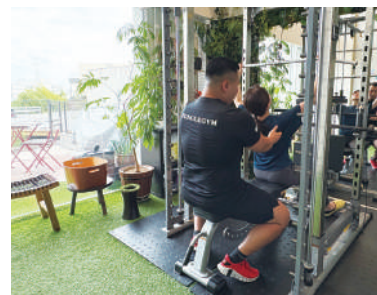
トレーニングは1回50分