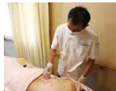
施術は丁寧に1時間かける