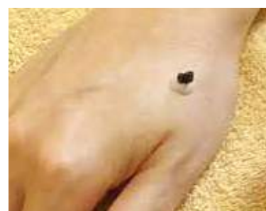
もぐさの下の白いものが灸の台座