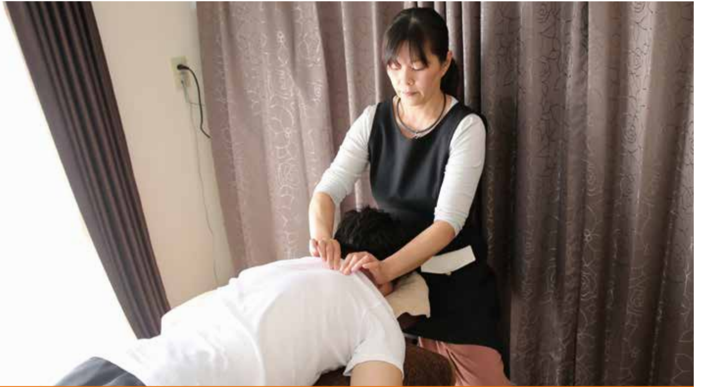
vol. 7 Sourire(スーリール) 浜松市南区芳川町