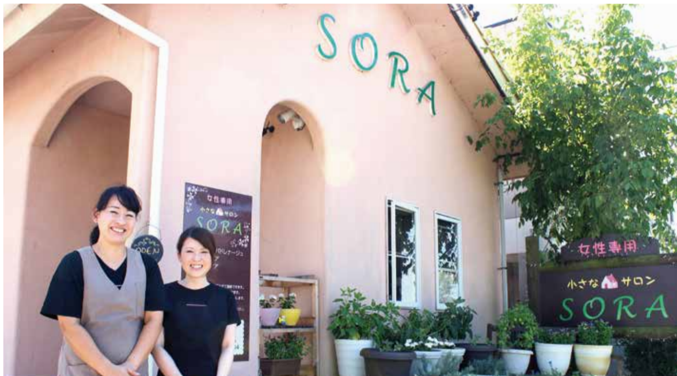
vol. 6 女性専用リラクゼーションサロン 小さなサロン SORA 浜松市西区大平台