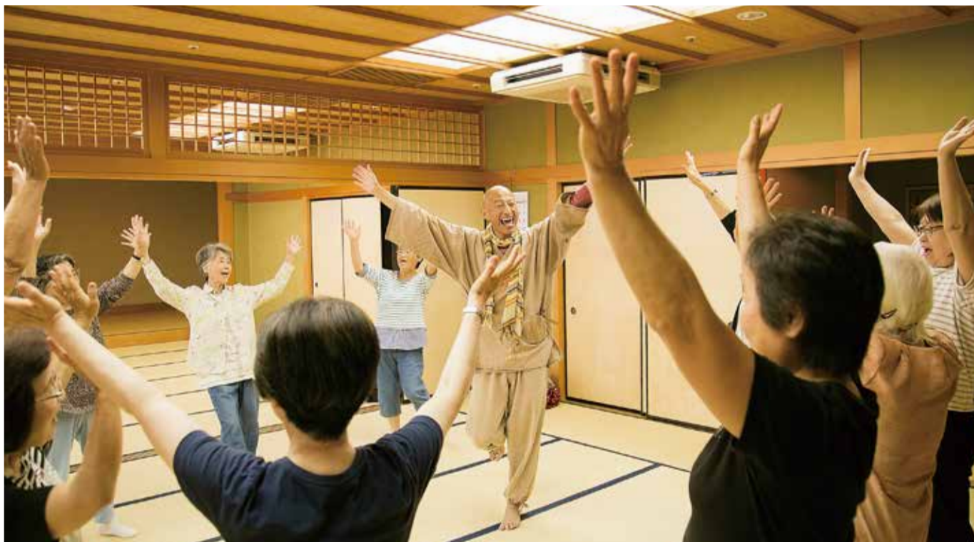
vol. 5 笑いヨガ Ossama Japan (おっさまジャパン) 浜松市西区雄踏町