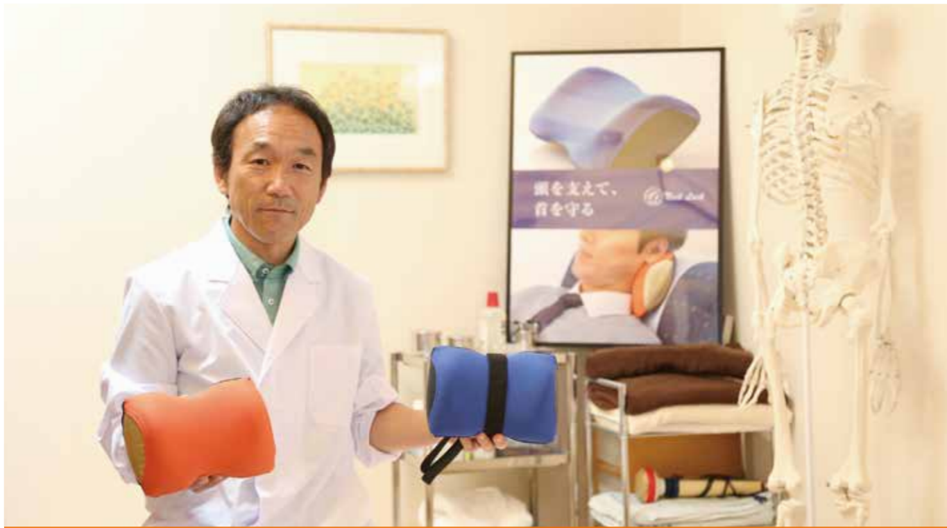
vol. 4 ゴルフスクール・ティーケイ 浜松市南区新橋町