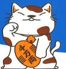
お助けねこ ニャンじゃ郎