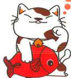
お助けねこ ニャンじゃ餅