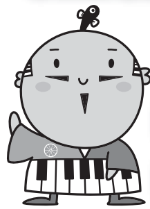
出世大名 家康くん