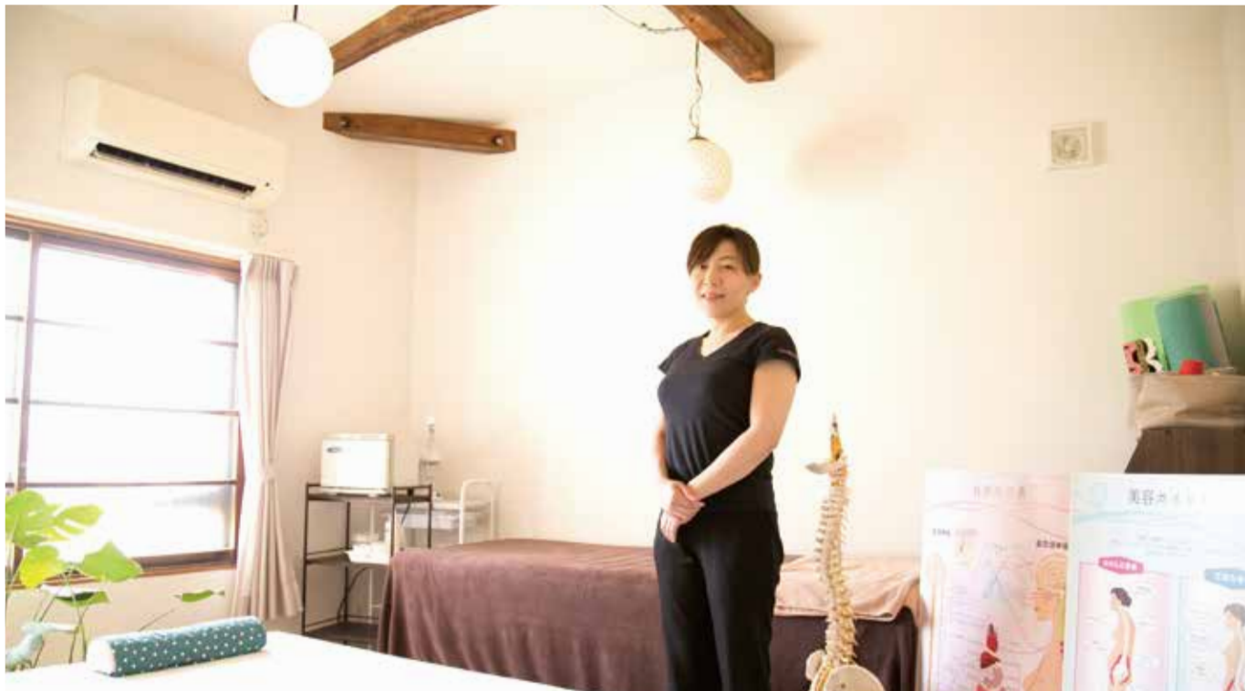
vol.2 椿カイロプラクティック 浜松市中区鹿谷町